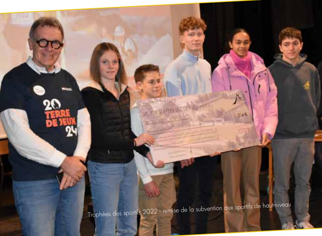
Trophées des sportifs 2022 - remise de la subvention aux sportifs de haut-niveau

Réalisation : service communication et service des sports de la ville de Mayenne. Impression : Imprimerie Solitaire - Nangis-sur-Mayenne. Illustrations : Club photo - Sports, Josée Anon