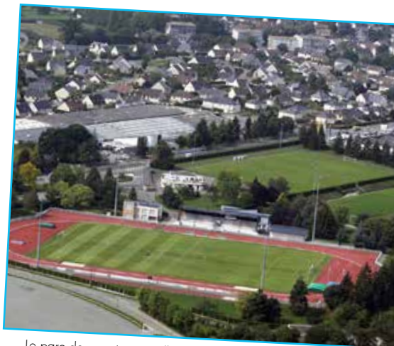
Le parc des sports accueille en 2021/2022 un nouveau terrain de foot synthétique. Le projet de développement du site prévoit l'accueil du club de tennis et un bâtiment pour l'athlétisme en salle

salons proposés tout au long de l'année. Le parc des expositions, entre hall et salle polyvalente, retrouvera les multiples associations utilisatrices.